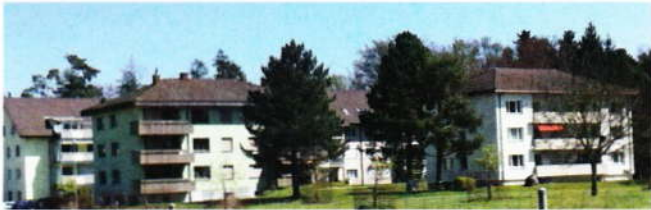
Mehrfamilienhäuser der Burgergemeinde

Die damaligen Verantwortlichen der Burgergemeinde trafen einen klugen Entscheid, das durch den Kiesabbau und durch die Deponie erworbene Geld in Immobilien zu investieren. Am Steinackerweg und Waldegweg wurden zwischen 1972 und 1994 vier Mehrfamilienhäuser mit 30 Mietwohnungen erstellt. Die Mieteinnahmen sind heute der tragende Teil der Burgerrechnung.