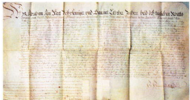
Dokument aus dem Jahre 1652 (Bürgerarchiv)

Man findet im Archiv der Bürgergemeinde Bannwil viele alte Akten aus den vorigen Jahrhunderten. Das älteste vorhandene Dokument stammt aus dem Jahr 1615.